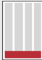
1/8 Seite (198x32)