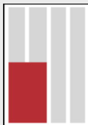
1/4 Seite (96x126)