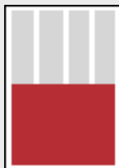
1/2 Seite (198x126)