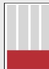
1/4 Seite (198x63)